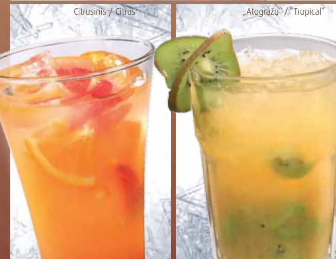
Citrusinis / Citrus