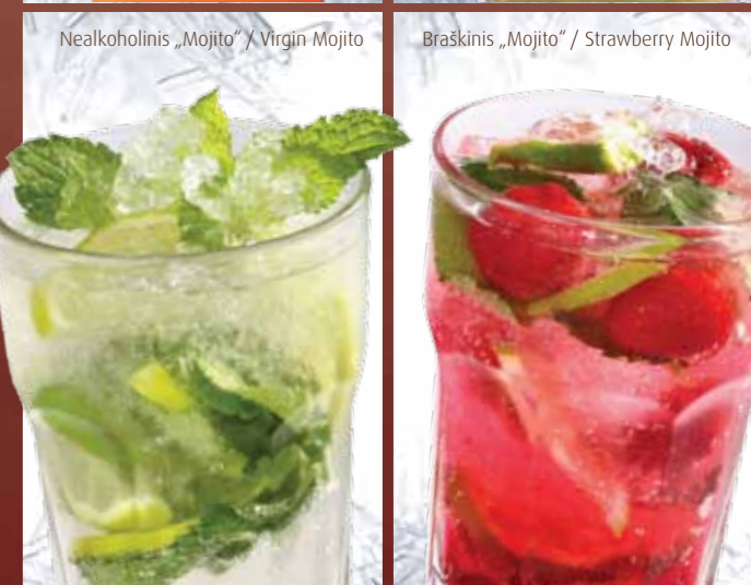
Nealkoholinis „Mojito“ / Virgin Mojito