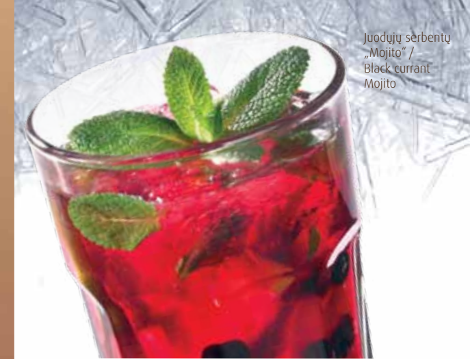
Juodųjų serbentų „Mojito“ / Black currant Mojito